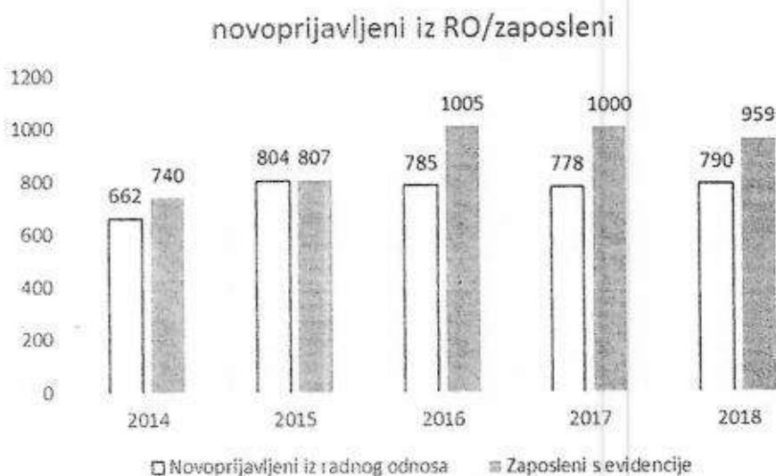
Graf 1: Pregled novoprijavljenih iz radnog odnosa i zaposlenih s evidencije

Zaposlenjem je odjavljeno 959 lica, od čega 360 žena raznih zanimanja, dok je u istom vremenskom razdoblju iz radnog odnosa prijavljeno 790 lica od kojih 324 žene.